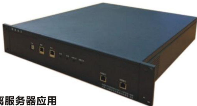
网络安全隔离服务器应用